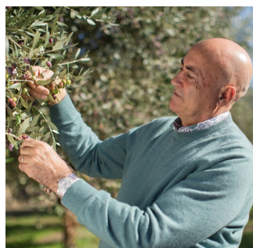
CAROLI: "UNA PASSIONE DIVENTATA UN LAVORO"

Le donne sono fatte per sorreggere il mondo! (dal film "A casa tutti bene" di Gabriele Muccino - 2018)