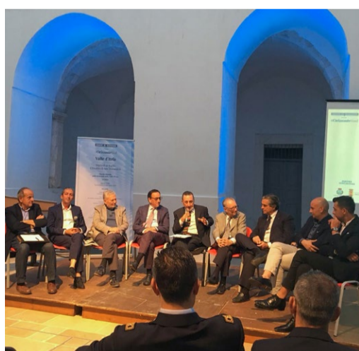
OSPITI DEL CORRIERE A ORIZZONTE SUD