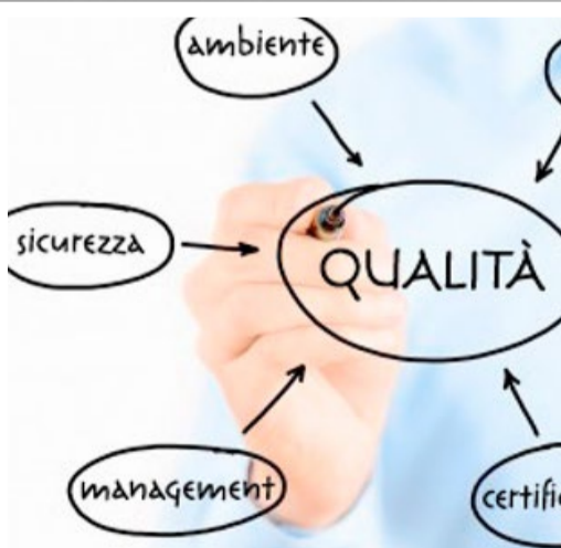
MARRAFFA-WERENT: CERTIFICATO DI QUALITÀ