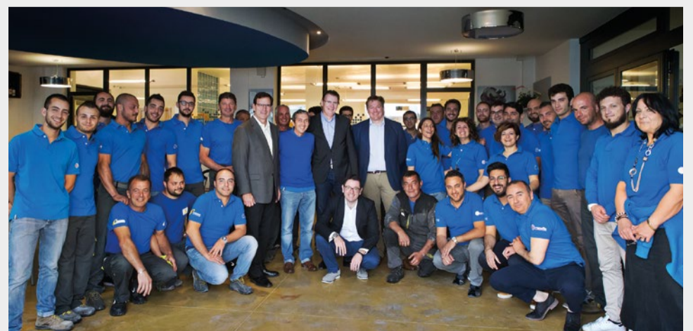
Lo staff Venpa Sud con i dirigenti della Jlg